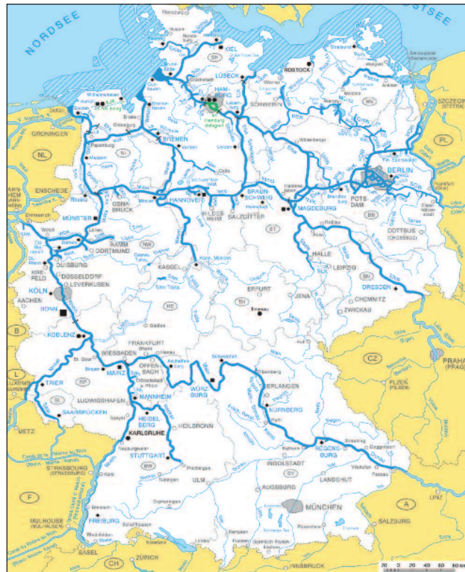
Quelle: Bundesministerium für Verkehr und digitale Infrastruktur, Januar 2014, Karte W 162 de Kartographie: Fachstelle für Geoinformationen Süd, Regensburg, zur Verfügung gestellt gemäß GeoNutzV Bundeswasserstraßen, die eine Länge von unter 5 km aufweisen, sind nachfolgend teilweise nicht dargestellt. ■ Bonn: Sitz der Generaldirektion Wasserstraßen und Schifffahrt (GDWS) ■ Mainz: Sitz einer Außenstelle der GDWS ● Elbe: Sitz eines Wasser- und Schiffsamtes u. dgl. ● Karlsruhe: Sitz einer Oberbehörde / Bundesanstalt — Grenze zwischen Außenstellen der GDWS — nicht klassifizierte BinWaStr — WaSt-Klasse I - III nach UN ECE — WaSt-Klasse IV - VI nach UN ECE